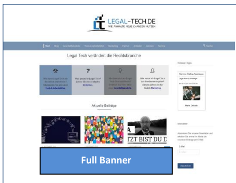
Banner auf der Startseite Größe: 800 x 200 px, RGB Preis: € 1.900/Monat

Freie Fachinformationen GmbH Consorsbank IBAN: DE34701204008451471000 BIC: DABDEM33XXX